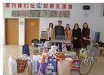
左图为北京康比特公司为星星雨教师赠送水杯。中图为德国大使馆圣诞义卖捐赠仪式。右图为日本人会妇人委员会为星星雨捐赠物品。