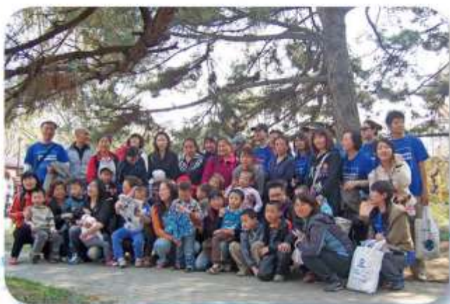
左上图志愿者为小朋友欢庆圣诞节时合影;左下图为志愿者进行慈善义卖活动;上图为志愿者陪同孩子们去香山植物园合影。