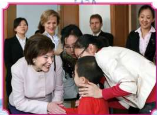
德国前总统夫人科勒女士到星星雨慰问