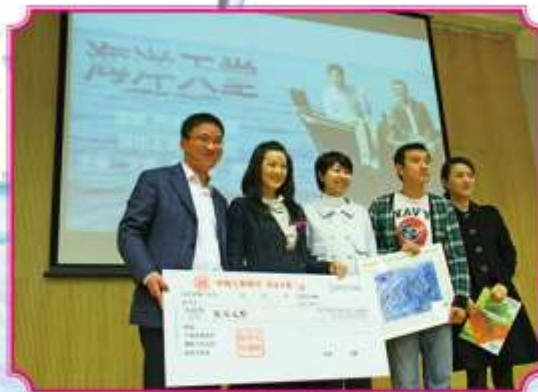
自闭症日，《海洋天堂》剧组为“星星雨”捐赠