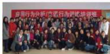
照片（左）心盟NGO基础知识培训班，23个机构的25名领导人参与。