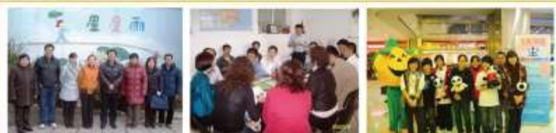
图片依次为北京市残联视察工作合影(左)清华大学NGO研究所进行调研(中)和中华世纪坛万圣节公益活动的志愿者合影(右)

2009年,是另人振奋的一年,法国总理夫人Penelope Filion接见了“星星雨”创办人田惠萍女士和执行主任孙忠凯先生,德国大使施明贤夫妇到“星星雨”参观访问,“星星雨”很荣幸成为首部讲述自闭症故事的电影《海洋天堂》演员生活的体验基地,要特别感谢这部电影编导薛晓路女士和著名演员李连杰先生及文章先生对自闭症儿童的关注与支持!