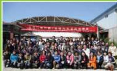
2008年4月4-8日，应用行为分析/言语行为训练培训班合影，来自全国60个机构的60名教师参加了本次活动。

感谢德国米索尔基金会和中国红十字会李连杰基金会计划的资助，促进孤独症服务行业的健康发展，让“心盟”茁壮成长！