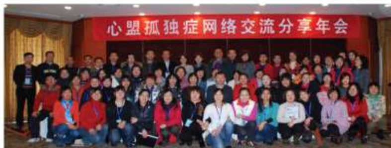
2008年12月31日“心盟”交流分享年会全体合影，来自全国41个机构的74名成员参加了本次活动。

2005年，在德国米索尔基金会的资助下，“星星雨”通过一系列行业培训、活动倡导，发起心盟孤独症网络（Heart-Alliance Network，简称“心盟”）。通过为同行业机构提供组织的能力建设培训&教师专业知识培训，促进同行业机构的健康发展。