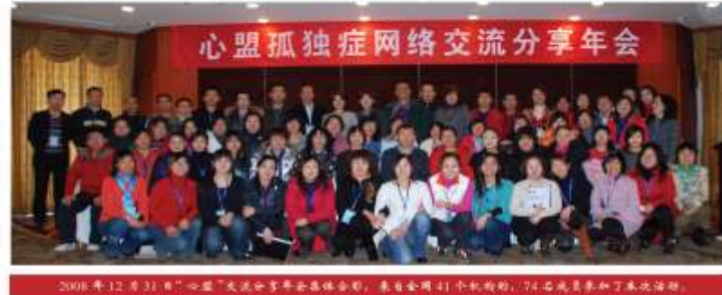
2008年12月31日“心盟”交流分享年会全体合影，来自全国41个机构的74名成员参加了本次活动。

2005年，在德国米索尔基金会的资助下，“星星雨”通过一系列行业培训、活动倡导，发起心盟孤独症网络（Heart-Alliance Network，简称“心盟”），通过为同行业机构提供组织的能力建设培训及教师专业知识培训，促进同行业机构的健康发展。