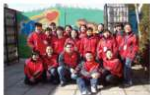
全体员工身着红色的工作服迎接新年的到来。