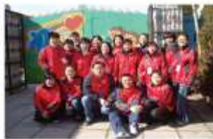
全体员工身着红色的工作服迎接新年的到来。