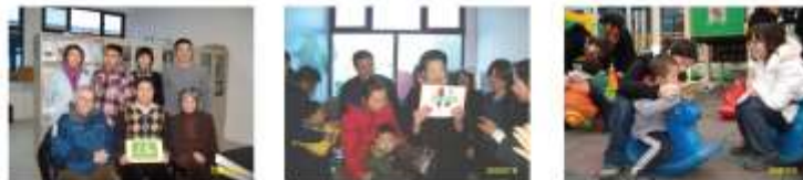
图片从左为北京残联社康中心合影(左)和日本青相大人参观“星星雨”(中)及志愿者照顾自闭症孩子(右)。

2008年我们与来自美国NGO Cool2care、美国维和大学、瑞士洛桑大学社会学系等6名科研人员分享中国孤独症服务行业发展与现状；接待了美国姊妹学校、德国特教团、新加坡星光学校、台湾儿童福利协会等同行业机构的参观，共计5次，18人；同时作为中国首批孤独症儿童家长培训机构和有社会工作文化背景的机构，我们也成为相关专业的科研和实践基地，08年我们与北京大学生命科学院建立起专业联系，香港大学、苏州大学、北京工业大学和中国青年政治学院都会派学生参与实践，全年共接待20名实习生；此外我们还接待了日本青相大人的访问，参加了第二届中非政府组织交流合作发展论坛、香港博爱“跨越看不到的障碍”的研讨会和北京社会工作委员会会议，在校内为6·12汶川地震组织了2次募捐的活动，筹集善款6626.51元，捐赠给北京市朝阳区接受康复治疗事务管理中心和中国青少年发展基金会，用于灾区校园的重建。