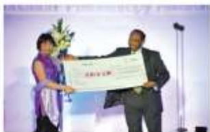
国际红十字会副秘书长伊布拉辛·曼斯曼（Ibrahim Osman）先生为“星星雨”颁李连杰基金会典范工程奖。