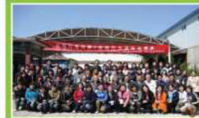
2008年4月4-8日，应用行为分析/言语行为训练培训班合影，来自全国60个机构的60名教师参加了本次活动。

感谢德国米索尔基金会和中国红十字会李连杰壹基金计划的资助，促进孤独症服务行业的健康发展，让“心盟”茁壮成长！