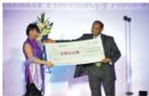
国际红十字会秘书长伊拉罕·麦纳克（Ibrahim Osman）先生为“星星雨”项目授予壹基金典范工程奖。