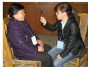
“星星雨”教师正在接受言语行为训练(VBA)培训。