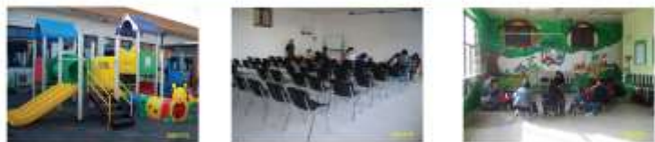
2008年10月“星星雨”第二教学楼改建工程竣工，张次为新增的游乐设备(左)，家长培训室(中)和课室的教学大厅(右)。宽敞明亮，欣在学中，感谢北京扶轮社(Rotary Beijing)的资助与支持!

感谢：加拿大沃顿儿童基金会资助举办的应用行为分析和言语行为训练研讨会 美国姊妹学校“心灵之春”的同事们为我们提供专业技术培训与支持 北京扶轮社(Rotary Beijing)为我们校舍的第三次重大改建工程提供资助